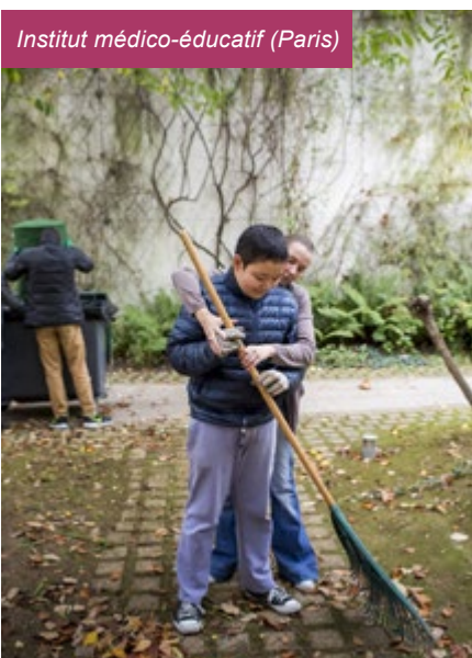
Institut médico-éducatif (Paris)

L'Institut médico-éducatif Cognacq-Jay accueille 21 jeunes entre 12 et 20 ans, avec autisme, parfois associé à d'autres handicaps, dans l'enceinte de l'Hôpital Cognacq-Jay (Paris 15e). Conformément au principe du droit à une éducation et à des soins spéciaux pour les enfants handicapés énoncé par la Déclaration des droits de l'enfant , l'IME initie depuis peu des ateliers de préprofessionnalisation au sein de l'hôpital , en plus des apprentissages dispensés par son unité d'enseignement intégrée.