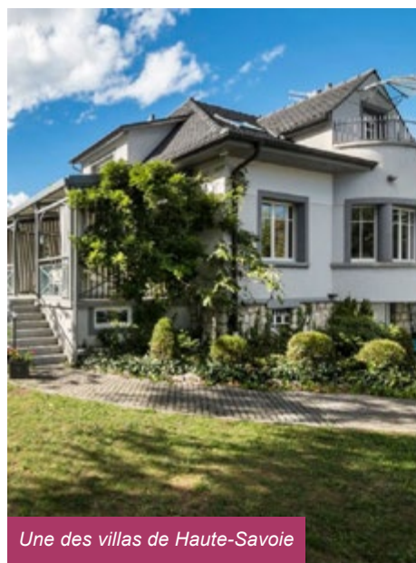
Une des villas de Haute-Savoie